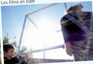
Les films en tube