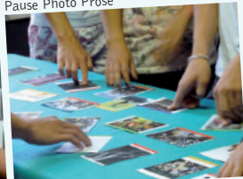
Pause Photo Prose